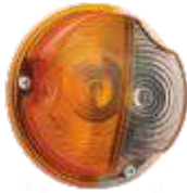
112.02.22 Фонарь передний