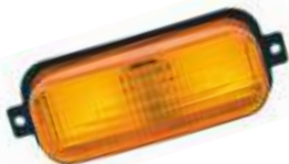
112.01.11 Указатель поворота