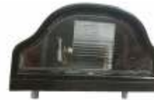
112.09.09 Фонарь освещения заднего номерного знака