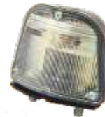
112.00.05 Фонарь освещения заднего номерного знака