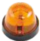
112.01.12 Указатель поворота боковой дополнительный