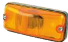
5702.3726 Указатель поворота боковой дополнительный