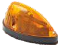
112.99.30 Знак опознавательный