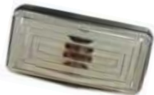
112.02.18 Указатель поворота боковой дополнительный 5 категории