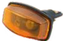
112.02.17 Указатель поворота боковой дополнительный 5 категории