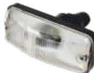
112.01.04 Фонарь освещения