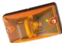
112.03.30 Указатель поворота боковой дополнительный